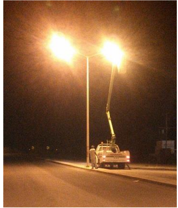
Mantenimiento de Alumbrado Público en Carretera a la Paz.