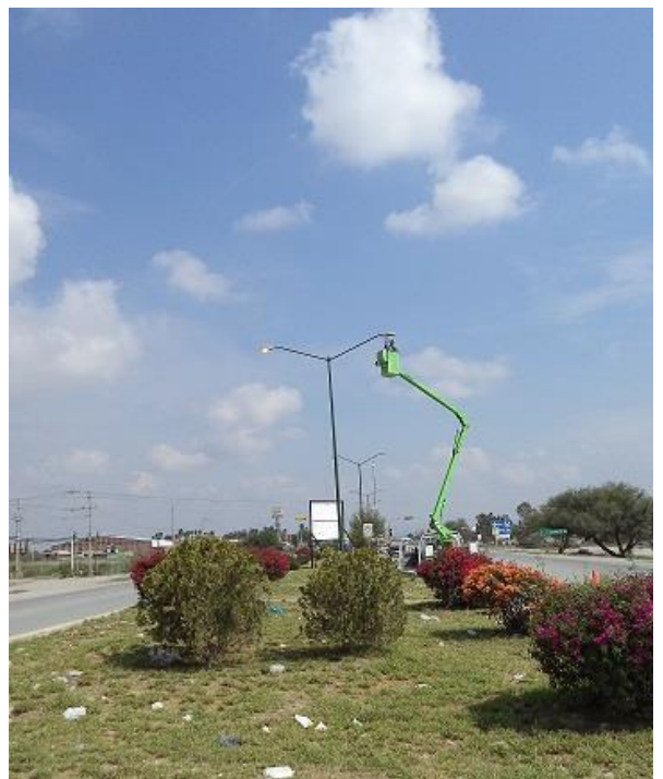
Mantenimiento de luminarias en Blvd. Turístico.