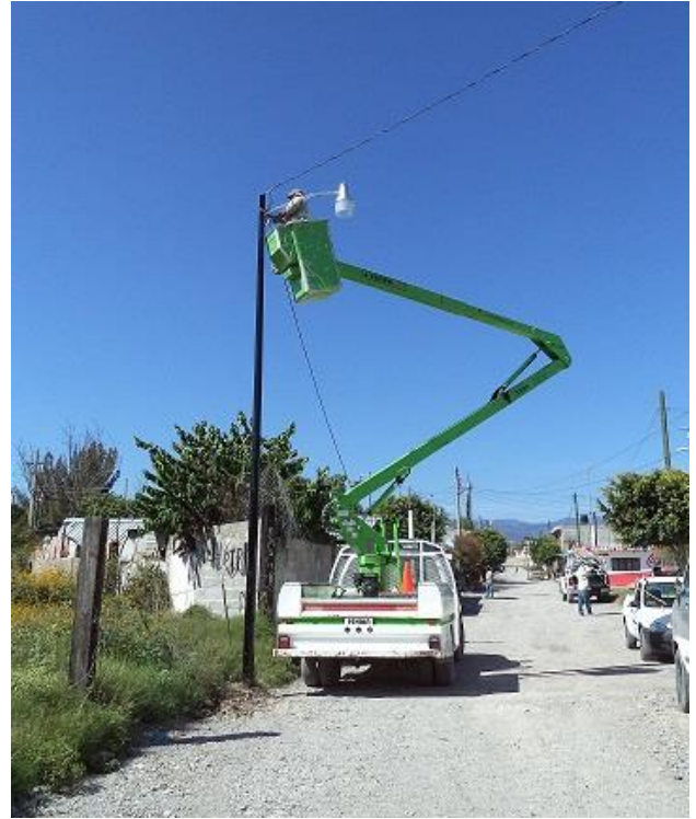
Instalación de luminarias en la Calle Baja California de la Col. República.