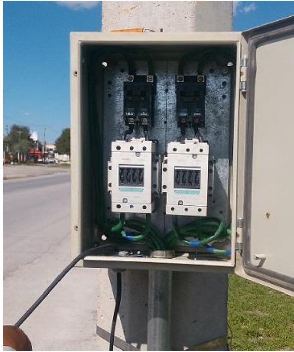
Cambio de controles de Alumbrado en el Blvd. Turístico.