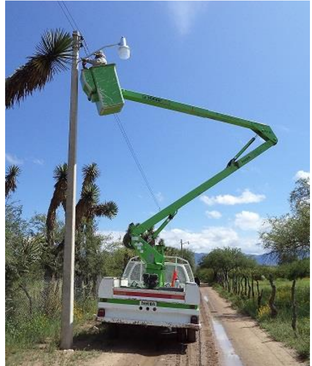
Instalación de luminarias en la Comunidad de Santa Cruz.