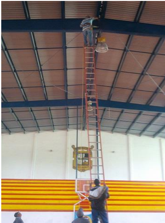
Mantenimiento de Alumbrado en el Auditorio.