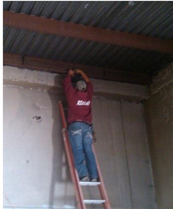
Instalación de luminarias en el interior del Rastro Municipal.