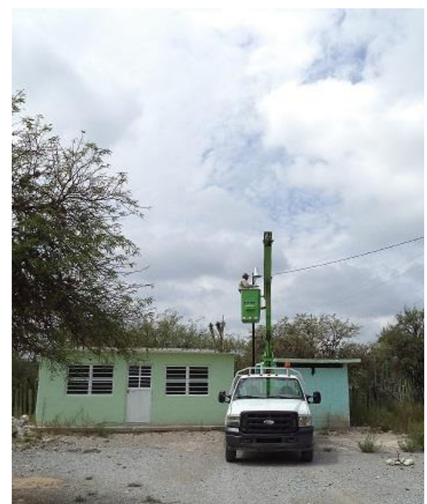
Reparación de luminarias en las Comunidades de Arroyito del Agua, La Caja y San Vicente.