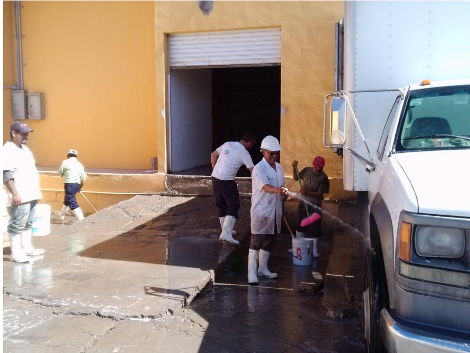
Reparacion de bancos (soldadura)