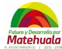
TABLA PARA ACTIVIDADES ADMINISTRATIVAS MES DE OCTUBRE DEL 2015