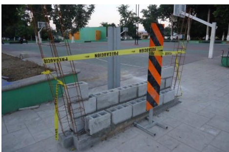
Ilustración 3.- Parque Álvaro Obregón