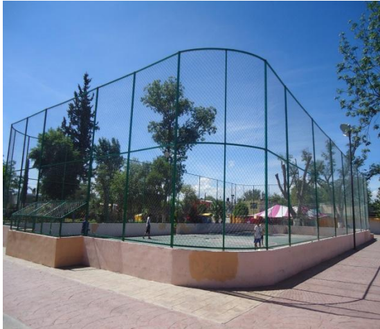
Ilustración 1.- Parque Álvaro Obregón cancha propuesta a colocar techumbre.