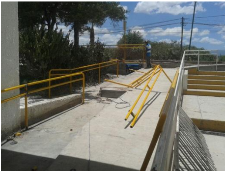
Ilustración 3.- D.I.F.