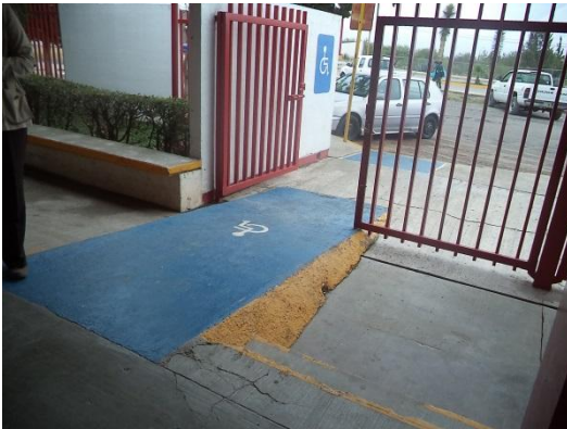
Ilustración 1.- C.E.C.A.T.I.