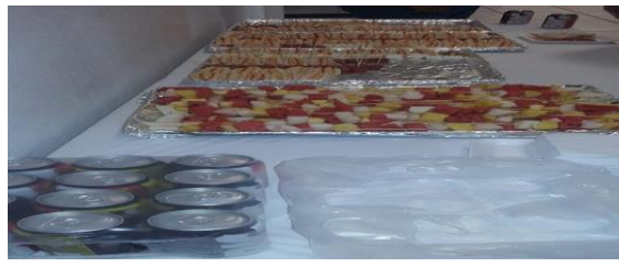
(A LOS ASISTENTES SE LES INVITÓ UN PEQUEÑO REFRIGERIO)