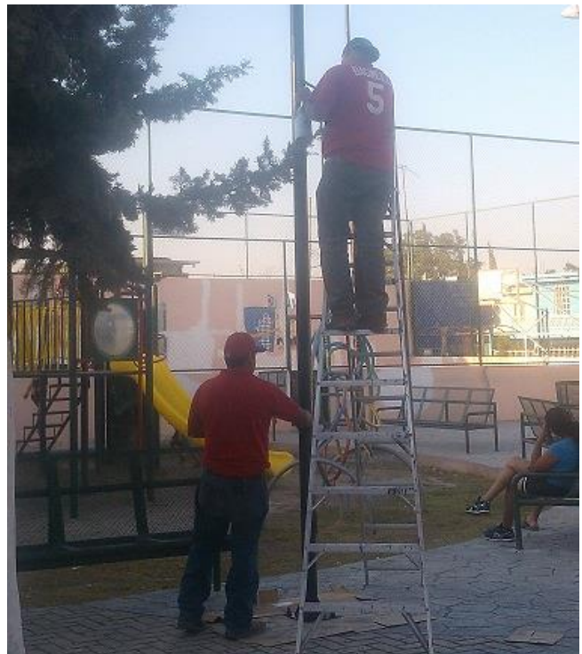
Mantenimiento de luminarias Plaza Col. Lazaro Cardenas.