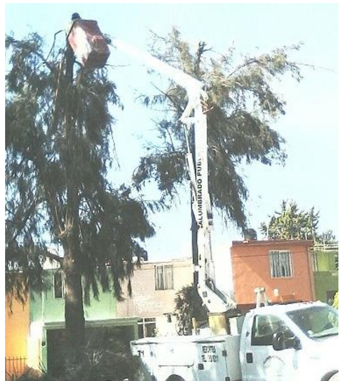
Apoyo al Departamento de Ecología en la poda de árboles en el And. Art. 123, Col. Inf. Fidel Velázquez.