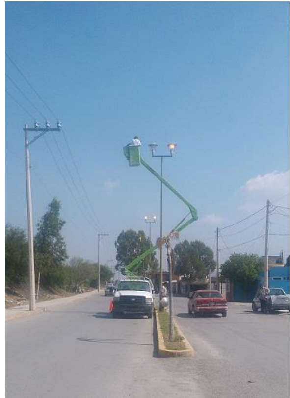
Mantenimiento de luminarias en la Av. Lerdo de Tejada.