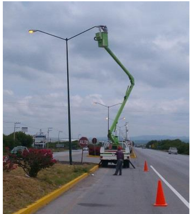
Mantenimiento de luminarias en el Blvd. Turístico Carr. 57.