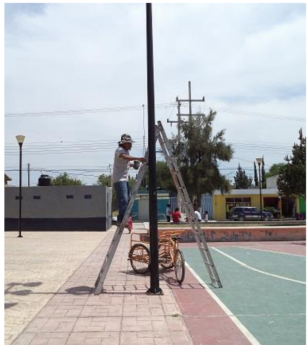
Mantenimiento de luminarias en la Plaza Deportiva de la Col. Olivar de las Animas.