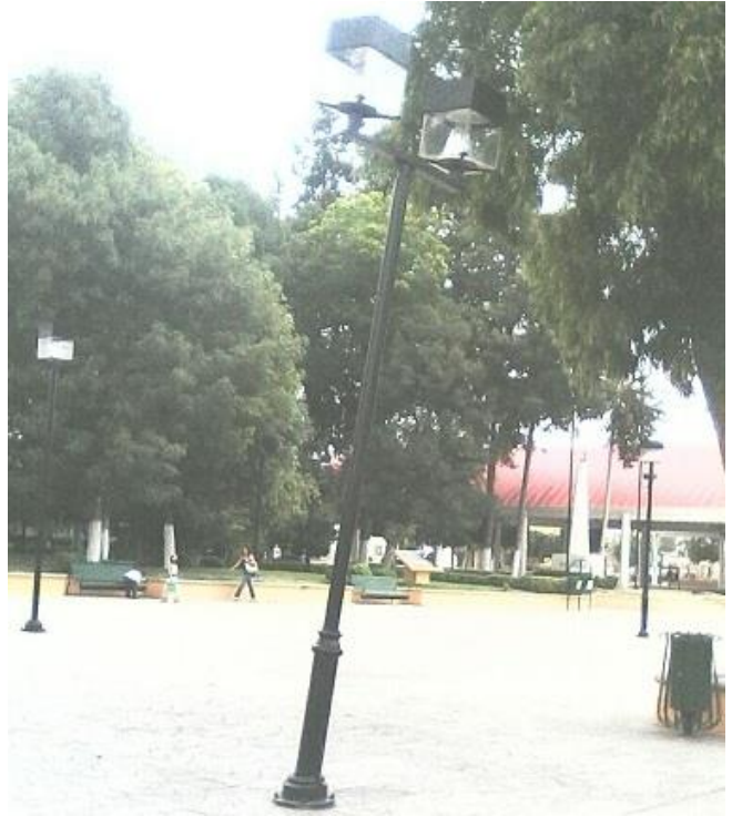
Mantenimiento de luminarias en el Parque Alvaro Obregón.