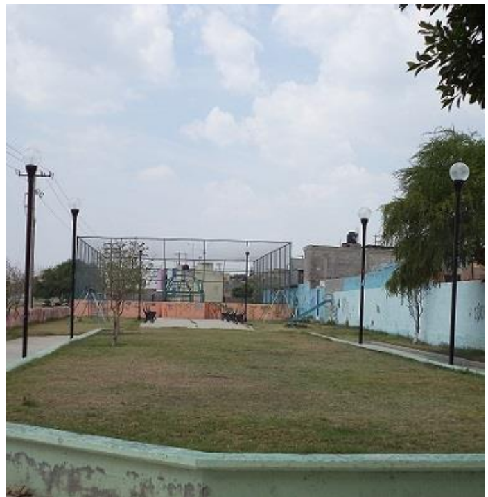
Reparación de luminarias rotas por vandalismo en la Plaza de la Col. Las Mercedes.