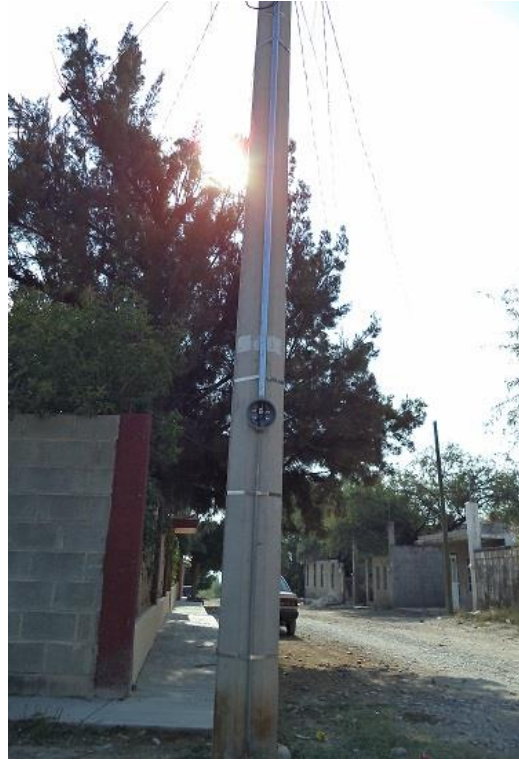
Instalación de Alumbrado Público calle 16 de septiembre, Comunidad de Santa Ana.