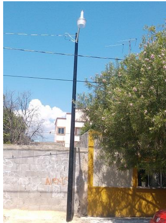
Ampliación de Alumbrado Público en las calles de Rivas Guillen y Libertad en la Col. Guadalupe.