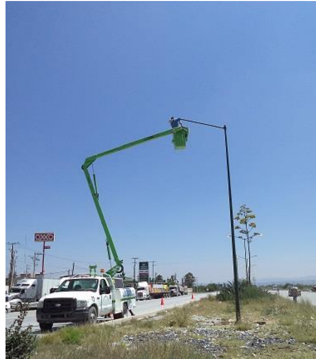
Mantenimiento en el Boulevard Turístico.