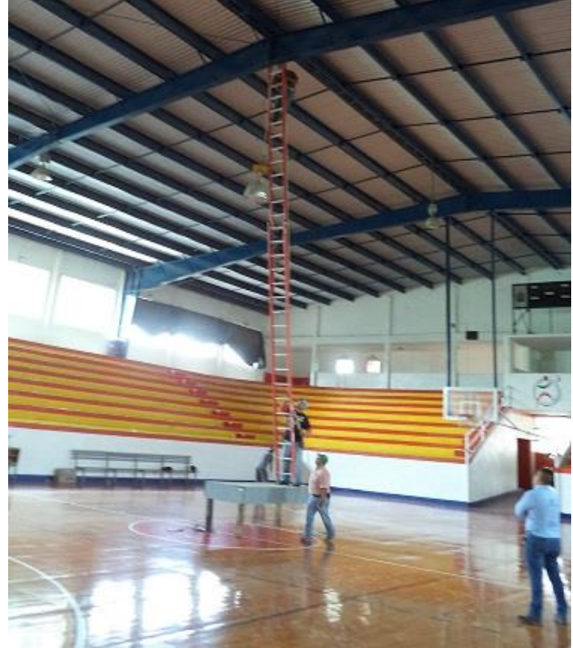
Reparación de proyector central de la cancha de basquetbol en el Auditorio Municipal.