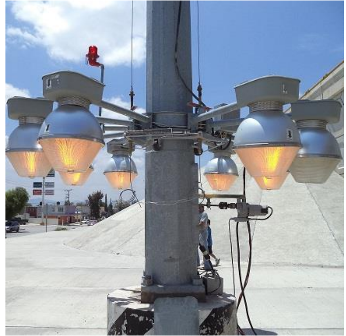
Mantenimiento de super postes en el Blvd. Turístico.