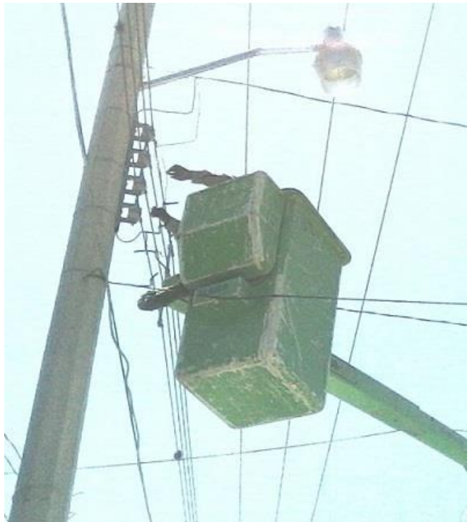
Colocación de poste metálico e instalación de luminaria en la Priv. Aldama, Col. Rivas Guillen.