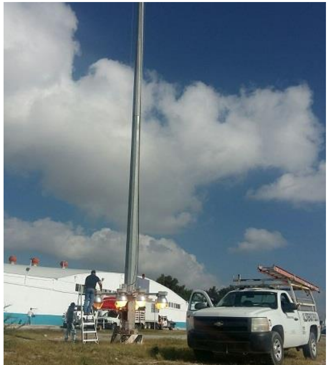
Mantenimiento de lamparas en la super torre ubicada en la calle Ángel Veral con Ignacio Ramírez.