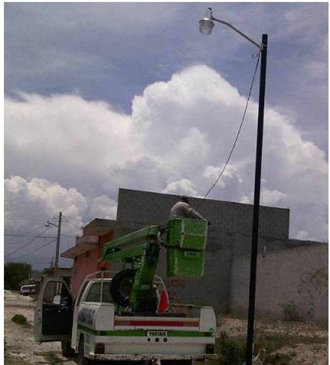
Instalación de postes metálicos y luminarias en la calle de San Luis de la Col. República.