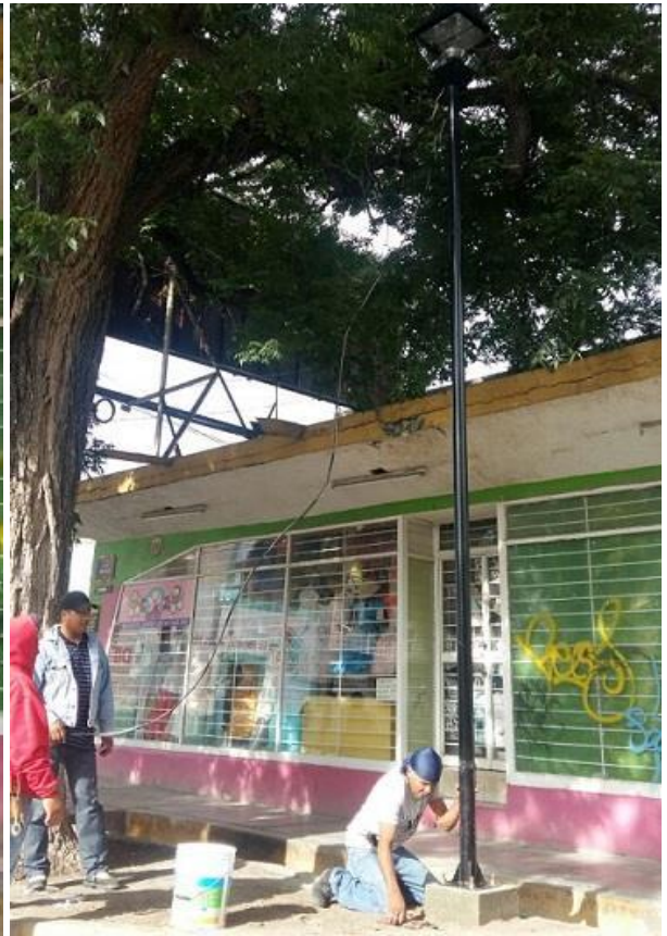
Colocación de poste metálico e instalación de luminaria en la calle Morelos esq. con Reyes en la Zona Centro.