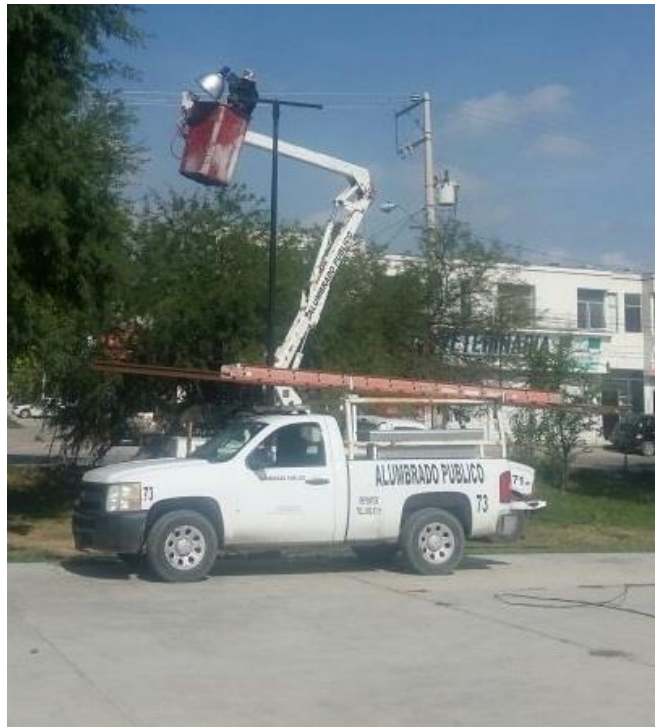
Colocación de poste metálico e instalación de reflectores en la Cancha ubicada en la calle Hidalgo.