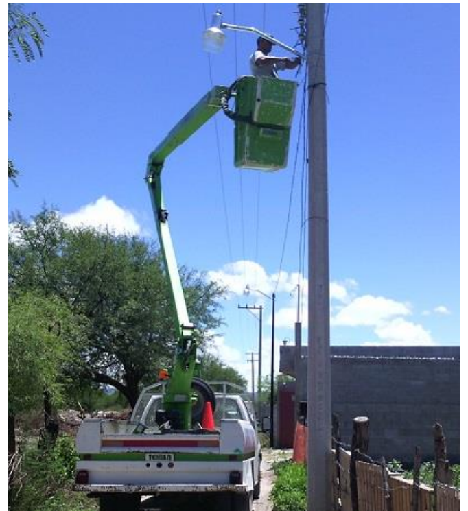
Colocación de poste metálico e instalación de luminarias en Callejón Antiguo en el Ojo de Agua.