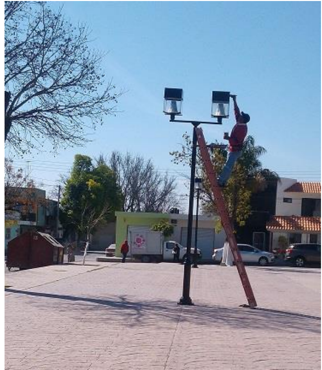
Mantenimiento y pintado de luminarias tipo cubo Parque Alvaro Obregón.