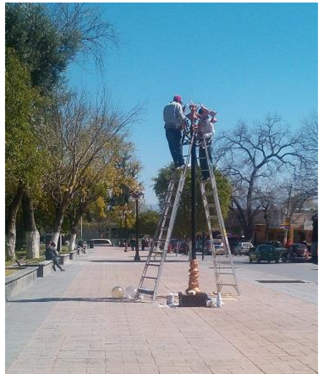
Mantenimiento y pintado de arbotantes tipo dragón en el Parque Vicente Guerrero.