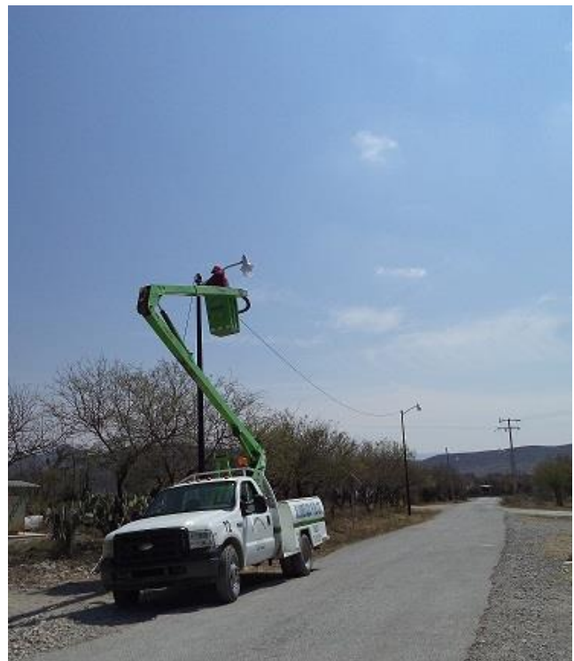
Instalación de luminarias en la Comunidad de Santa Brígida.