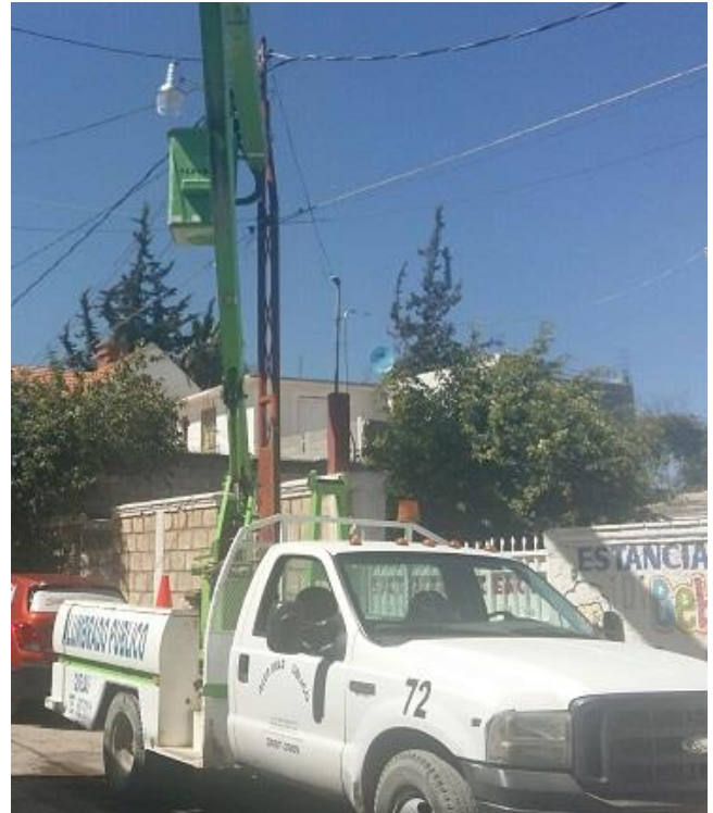
Instalación de luminaria en la calle de Bugambillas.