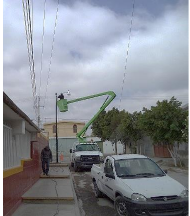
Instalación de poste y luminaria en la calle 5 de Febrero.