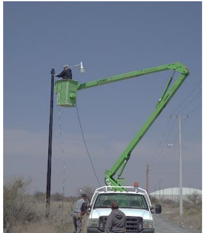
Instalación de poste y luminarias en la calle de Victoria de la Col. Hacienda.