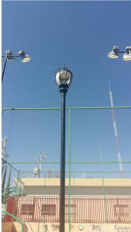
Luminarias rotas por vandalismo en la Col. Vista Hermosa.